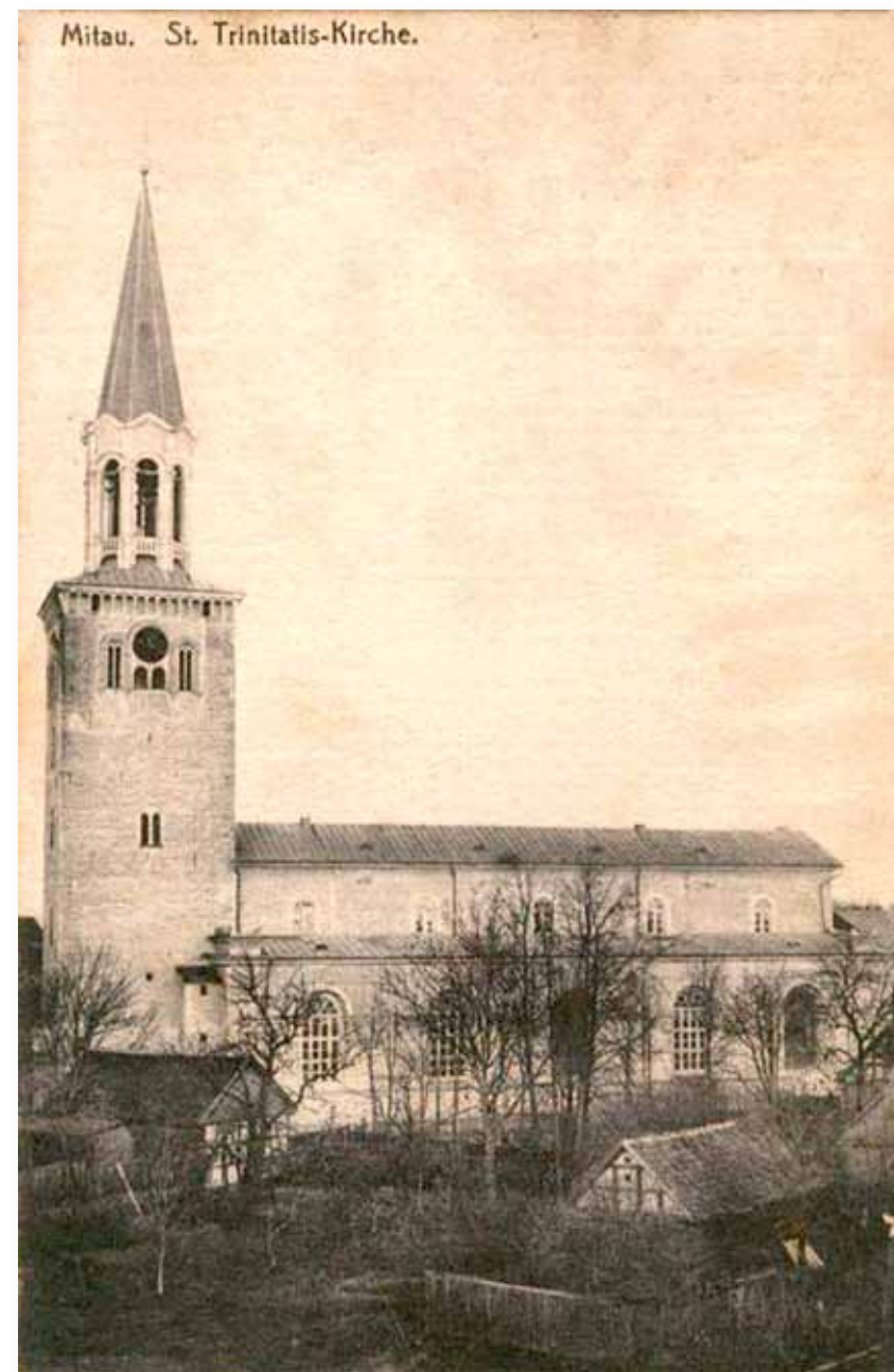
Sv. Trīsvienības baznīcas dienvidu fasāde, 20. gs. sākuma pastkarte

Vai jaunās Sv. Trīsvienības baznīcas pamatakmens likts jau iepriekšējā - 1573. gadā? Loģiski ņemot - jā. Ja no 1574. gada aprīļa līdz septembrim dievnama celtniecībā ik dienas intensīvi strādāja