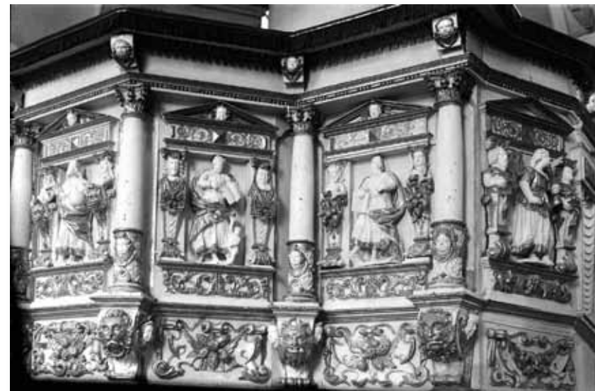
Kanceles fragments, 1939. gada foto

Nākamais lielākās pārbūves cēliens sākās 1862. gada 16. aprīlī, kad Sv. Trīsvienības baznīcas draudze kārtējo reizi ķērās pie dievnama izskata maiņas, šoreiz