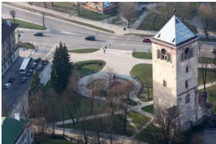
Labiekārtotā kvartāla daļa Lielās un Akadēmijas ielu stūrī, 2007. gada foto

sadalīt septiņos funkcionāli izmantojamus stāvos, kurus savienotu lifts un kāpnes. Saskaņā ar koncepciju stāvi būtu pielāgoti Jelgavas Dzimtsarakstu nodaļas administratīvajām un ceremoniju telpām, izstāžu zālei, tūrisma informācijas un suvenīru tirdzniecībai, kā arī sniegtu iespēju no vaļējas skatu platformas vērot pilsētas ainavu. Jāatzīmē, ka šis projekts un konceptuāli izstrādātie priekšlikumi iezīmēja pagrieziena punktu Sv. Trīsvienības baznīcas torņa atjaunošanas un jaunu izmantošanas funkciju meklējumos. Turpmākie Jelgavas pilsētas Domes nodomi, projekti un to īstenošana principā balstījās uz SIA AVARS izstrādāto torņa atjaunošanas projektu, to gan attīstot, gan variējot un precizējot detaļas.