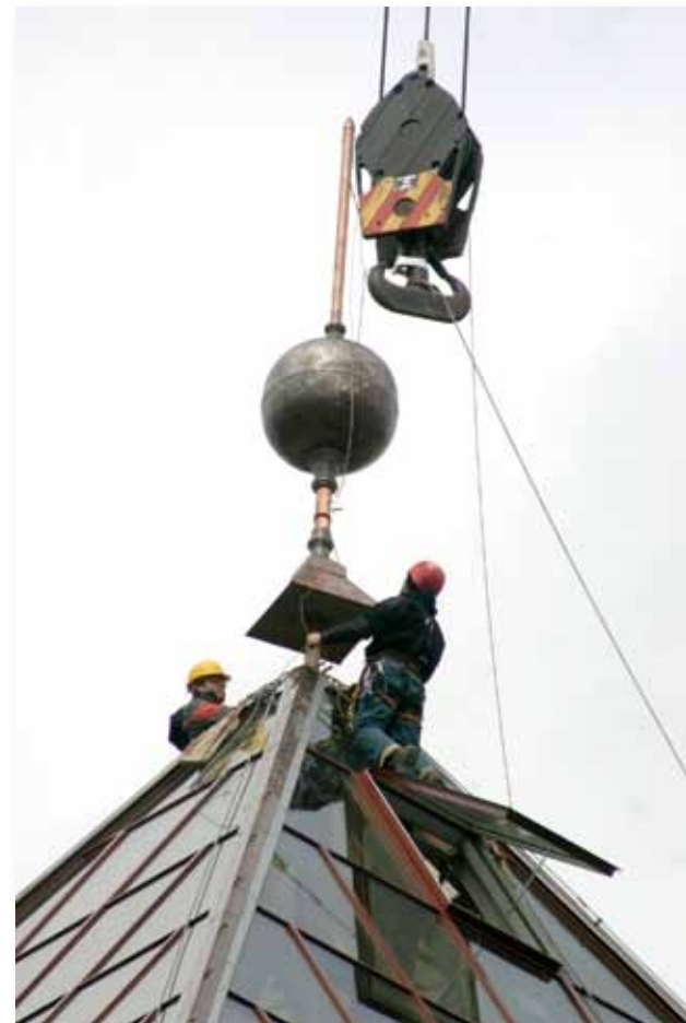
Zibensnovedēja un lodes uzstādīšana torņa smailē 2005. gada pavasarī

tus dokumentus, vēstījumu nākamajām paaudzēm un monētu komplektu. Tagad torņa kopējais augstums no pamatiem līdz zibensnovedēja smailes galam ir 50,17 metri. Šis pēdējais simboliskais žests ar dokumentu un vēstījuma ievietošanu torņa jumta smailē visiem lika skaidri noprast, ka ar to darbs pie torņa jumta arhitektoniskā veidola un tā īstenošanas paliekošās konstrukcijās ir noslēdzies.