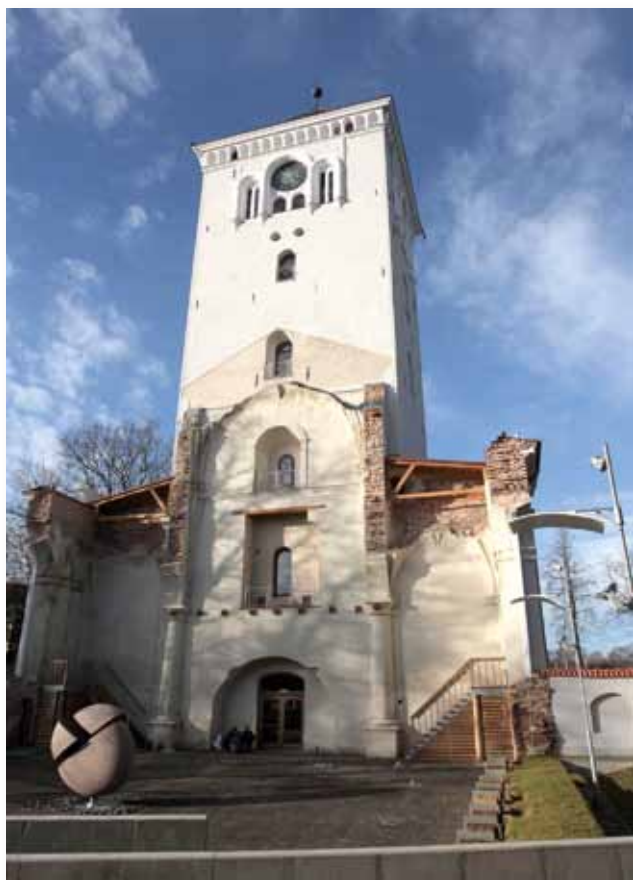
Restaurētajā tornī saglabātas liecības par dievnama interjera fragmentiem 2010.gada oktobrī

19. gadsimtā no ķieģeļiem mūrētais un apmettais ieejas portāls, taču torņa restaurācijas gaitā visapkārt portālam ir nokalta šaura apmetuma josla kā dokumentāla liecība par oriģinālā 17. gadsimtā kaltā akmens portāla formu. Celtnieki ir darījuši maksimāli daudz, lai arhitektūras pieminekli konservētu un eksponētu bojā gājušā dievnama interjera fragmentus: velvju pēdas, profilētā apmetumā darinātās velvju ribu konsoles, logu apmales, torņa sienai piemūrētos pilastrus, kuri ļauj iztēloties iespaidīgā dievnama vidusjoma un sānu jomu aug-