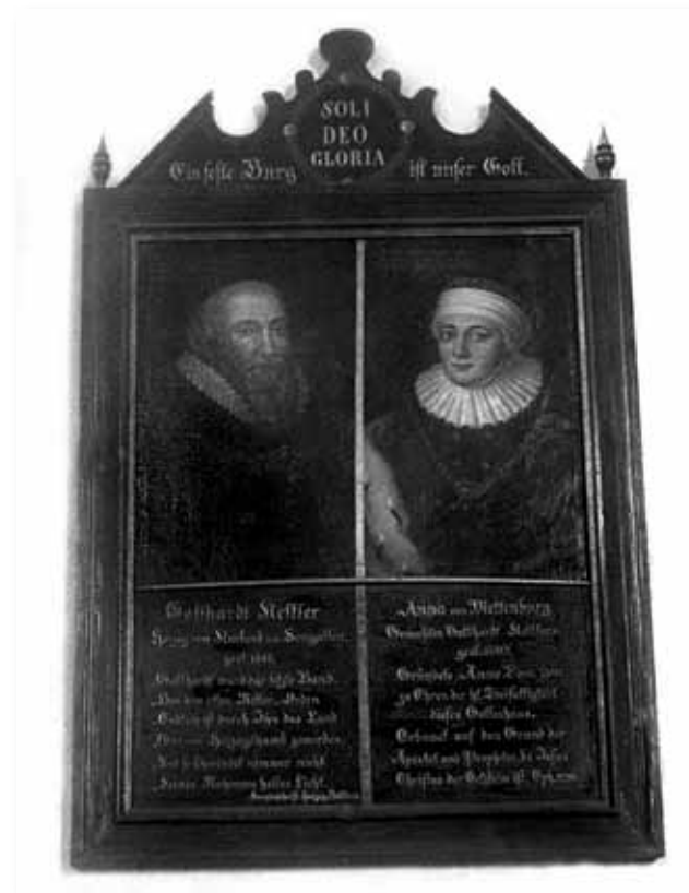
Hercoga Gotharda Ketlera un viņa sievas Meklenburgas princeses Annas epitāfija, 17. gs. sāk.

dievnams – netālu no iepriekšējā – koka dievnama un no tā atsevišķi celtā zvanu torņa. Tikai 1620. gadā hercogs Fridrihs dāvājis vācu draudzei zemi starp abām ieliņām un Driksu baznīcas pagalma un