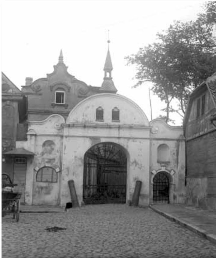
Sv. Trīsvienības baznīcas vārti, 1692.gads

ģerboņi, kas vairs nav saglabājušies. Turpat bijuši redzami arī iekalti abu dāsno jelgavnieku vārdi un datējums „1692”. Vārtu ziemeļpuses zemākā caurstaigājamā arka tikusi aizmūrēta 1811. gadā, kad blakus kapsētai uzceltajā namā grāmatsējējs ar baznīcas ziņu ierīkojis darbnīcu un vārtu arkā – ar slēgiem aizdarāmu lodziņu.