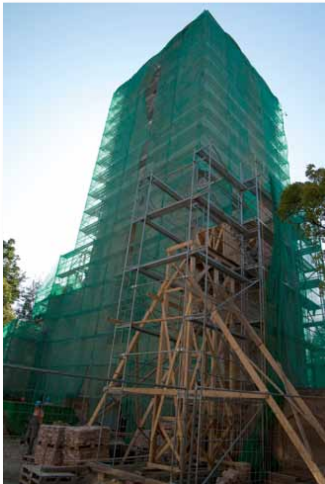
Tornis būvkonstrukciju ielenkumā 2009. gadā

nozīmes arhitektūras pieminekļu skaitā, tad vēl pēc kāda laika tornis atkal nokļuva atpakaļ Jelgavas pilsētas izpildkomitejas Kultūras nodaļas bilancē. Meklējot Sv. Trīsvienības baznīcas torņa atjaunošanai jaunu risinājumu, pilsētas vadība lūkojās uz Latvijas Lauksaimniecības akadēmijas kā vēlamā izmantotāja un Izglītības ministrijas kā iespējamā finansētāja pusi. Trešās Atmosferas gaisotnē bija dzimusi iecere tornī ievietot studentu bibliotēku un 1989. gada pavasarī sākās torņa konservācija,