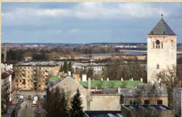
Pilsēta ar Sv. Trīsvienības baznīcas torni un Driksas upi no putna lidojuma

Aprit jau septītais gadu desmits, kopš šodienas Jelgavā, agrāk par Mītavu sauktajā Kurzemes hercogistes galvaspilsētā - tieši pilsētas vidū, pāri Lielupei un Driksai skatāmajā pilsētas panorāmā paceļas strups torņa siluets, kurš tikai pirms dažiem gadiem ieguva piezemētas četrskaldņu piramīdas formas jumtu. Lai arī no stikla, tas ir un paliek tikai simbolisks atgādinājums par tām 1944. gada pēdējām jūlija dienām, kad, II Pasaules kara beigu cēlienā vācu armijai atkāpjoties, dega Jelgava un kopā ar to liesmās gāja bojā viss tās krāšņums. Tagad pilsēta paceļas no jauna. Agrākās koka Jelgavas vietā slejas silikātķieģeļu, betona un stikla konstrukciju nami, bet masīvais tornis bez jumta smailes piecstāvu ēku vidū tik un tā atgādina: vēl karš nav beidzies! Vēl Jelgava nav uzcelta!