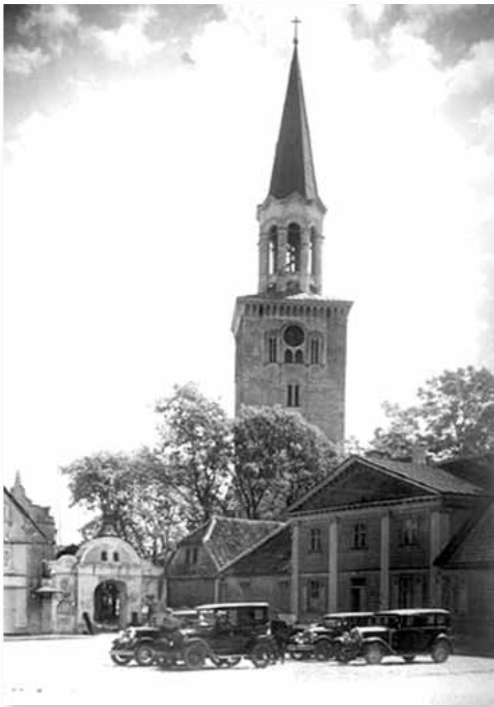
Sv. Trīsvienības baznīcas tornis no tirgus laukuma puses, 20. gs. 20. gadu foto

Eihvalds (Eichwald) apjuma torņa smaili ar „balto Sibīrijas skārdu”, kā tolaik sauca alvotu materiālu. Šim darbam 24.oktobrī pulksten pustrījos sekoja īstā, ar vara skārdu apstītā un apzeltītā krusta un lodes uzstādīšana torņa galā. Precīzākām ziņām