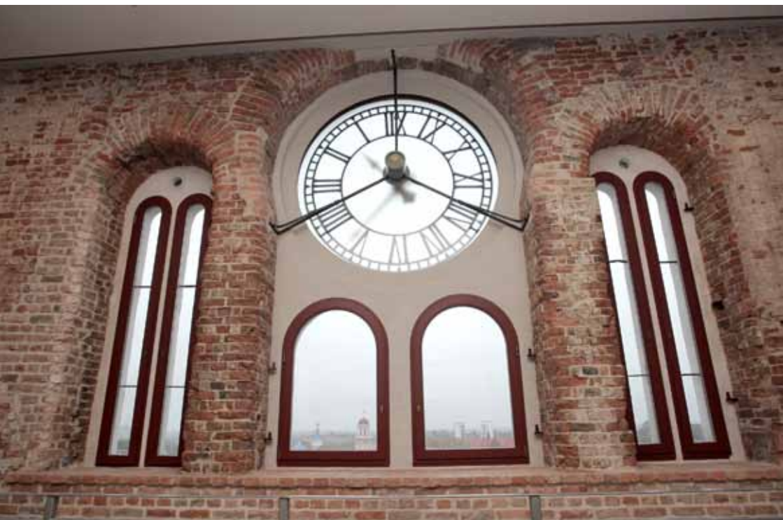
Pulksteņa stikla ciparnīca no torņa iekšpuses