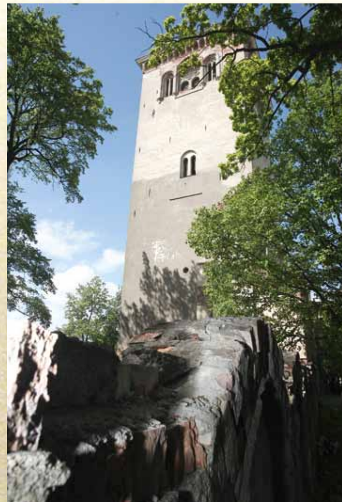
Sv. Trīsvienības baznīcas tornis pirms atjaunošanas

nā korpusa un torņa ārējo sienu apskates rezultātā nācām pie slēdziena, ka izdegušā arhitektūras pieminekļa atjaunošanai visas sienas ir derīgas, jo tās ir pilnīgi stabilas un samērā labā stāvoklī”.