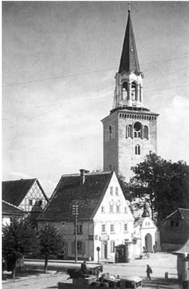
Sv. Trīsvienības baznīcas tornis no tirgus laukuma puses 20. gs. 20. gadu foto

liek fakts, ka hercogs, izdodot 1567. gada 28. februāra rīkojumu, ir domājis arī par nepieciešamību Jelgavā celt veselu kompleksu - baznīcu, skolu un nespējnieku namu. Tomēr tas neizslēdz iespēju, ka draudzes lietošanā jau būtu bijis kāds agrāk celts koka dievnams ar zvanu torni tam blakus. Ja tāda nebūtu, tad kur būtu pulcējusies luteriskā vācu draudze, ja par to kā stabili izveidojušos un darbo-