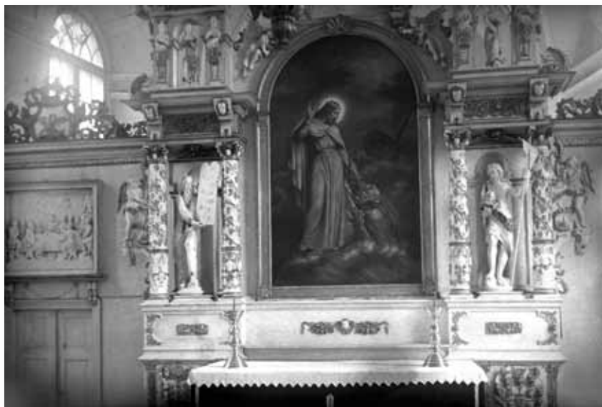
Altāra fragments, 1939. gada foto