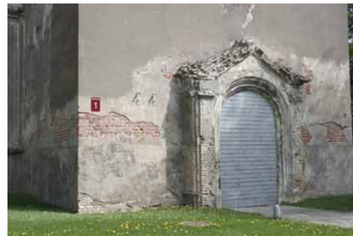
Torņa portāls pirms restaurācijas