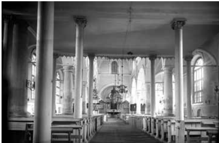
Skats uz altāri no ieejas draudzes telpā, 1939. gada foto

Vairāki fakti norāda uz 1610. gadu kā samērā drošu baznīcas celtniecības pabeigšanas datējumu. Galvenajos vilcienos jaunā baznīcas ēka un nepilnā augstumā arī tornis ir bijuši uzcelti jau 1574.-1575. gadā, tā, ka dievnama galveno apjomu jau toreiz varēja uzskatīt par pabeigtu. Tomēr paredzētajā augstumā tornis vēl nav bijis uzcelts. Tā celtniecībā strādāts arī 16.-17. gadsimtu mijā, un, kā par to liecinājuši Konsistorijas rēķini, 1611. gadā uz torņa augšstāvu atkal ir ticis pārcelts pulksteņa mehānisms. Jāpieļauj arī doma, ka tieši hercoga Gotharda Ketlera atraitne Meklenburgas princese Anna pēc turpat divdesmit gadu ilgas stagnācijas uztņēmās interjera izbūves un apdares finansēšanu. Kopš laulībām ar Gothardu Ketleru un pārcelšanās uz Kurzemi