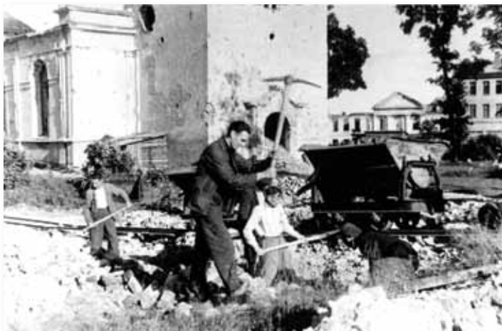
Sagrautās Jelgavas drupu novākšana. Fonā - nodegusi Sv. Trīsvienības baznīca. 20. gs. 40.-50. gadu mijas foto