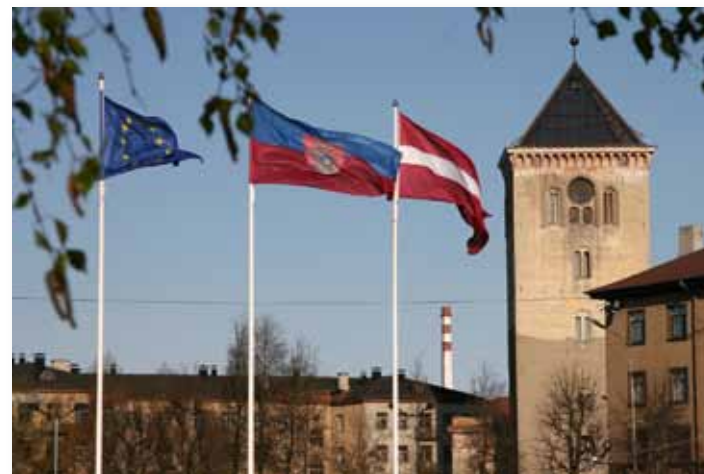
“Cerība - Eiropa”: ES, Jelgavas un Latvijas karogi pie Sv. Trīsvienības baznīcas torņa 2005. gada 4. maijā

Jelgavas pilsētas pašvaldības būvvaldē ir iespējams iepazīties ar piecdesmit četrus gadus ilgo atzīšanas un atdzimšanas hronoloģiju. Tur daudzās biežās mapēs fiksētas Sv. Trīsvienības baznīcas un tās torņa likteņgaitas. Torņa vēsture brīžam izskatās bezcerīga, brīžam atkal raisa mazliet optimismu, taču